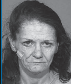
... e 2 anos e meio depois

“ C omecei a usar o cristal quando estava no colégio. Antes do meu primeiro semestre da faculdade terminar, o cristal se tornou um problema tão grande que desisti da faculdade. Parecia que eu tinha catapora porque ficava horas me olhando fixamente no espelho e me beliscando. Passava todo meu tempo usando cristal ou tentando consegui-lo.”