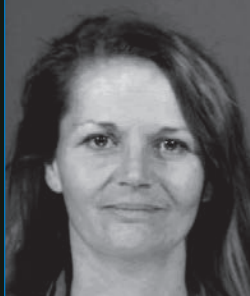
Usuária de Metanfetamina em 2002

Consequentemente, é uma das dependências químicas mais difíceis de se tratar e muitos morrem por causa da droga.